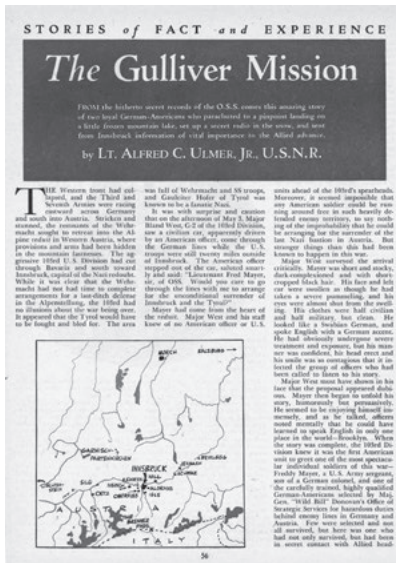
002 Erste Story über die Operation Greenup im Blue Book Magazine , April 1946.