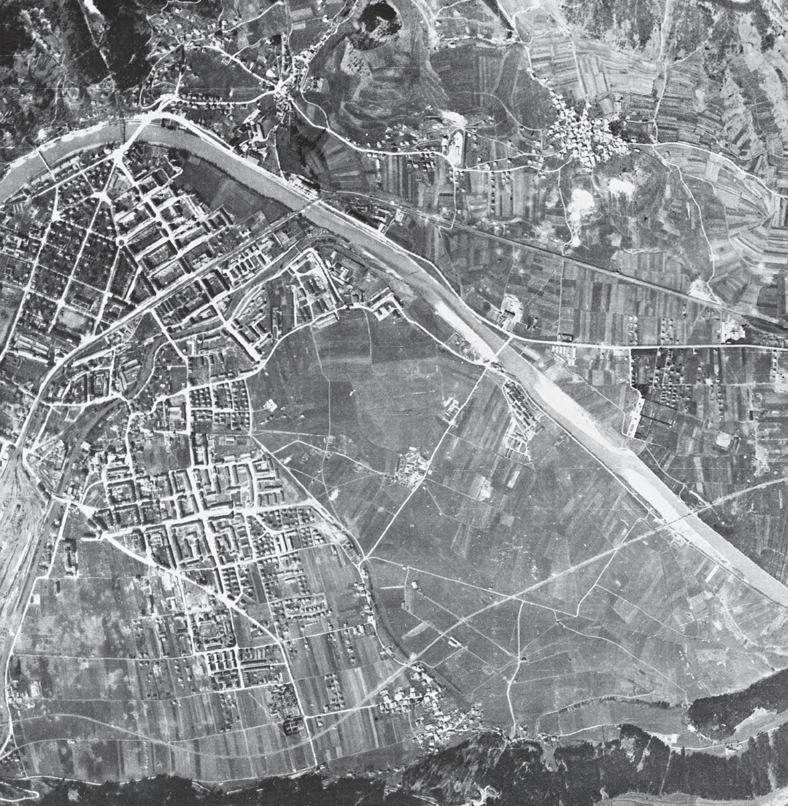
Luftbild von Innsbruck, 28. April 1945.